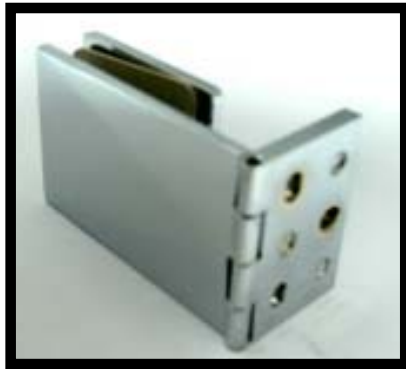
編號：RG0015CH, SC 外銷大鑽石壁對玻璃鉸鍊 產品色澤：FIN(亮銀CH、霧銀SC) PAT：77768(專利字號) 產品用途：玻璃、木工通用 工業技術研究院/ 系統與航太技術發展中心測試 (工服編號：T2004303A0)