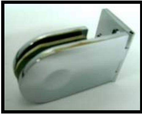
編號：RG0013CH, SC 外銷大蝴蝶壁對玻璃鉸鍊 產品色澤：FIN(亮銀CH、霧銀SC) PAT：78302(專利字號) 產品用途：玻璃、木工通用 工業技術研究院/ 系統與航太技術發展中心測試 (工服編號：T2004303A0)